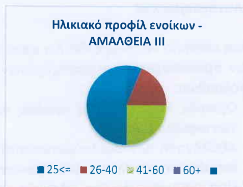
Εικόνα 2 Ηλικιακό προφίλ ενοίκων ΑΜΑΛΘΕΙΑ III