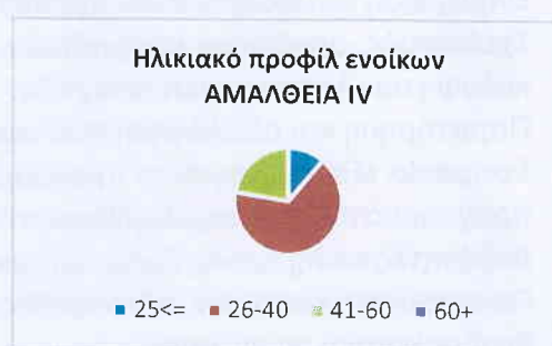
Εικόνα 3 Ηλικιακό προφίλ ενοίκων ΑΜΑΛΘΕΙΑ IV