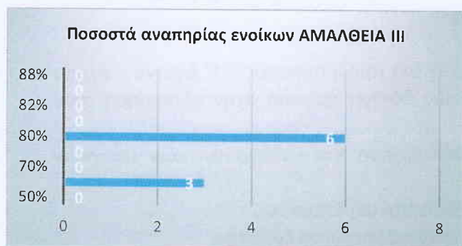
Εικόνα 1 Ποσοστά αναπηρίας ενοίκων ΑΜΑΛΘΕΙΑ III

Λόγω αναστολής του επισκεπτηρίου στις δομές, πραγματοποιήθηκαν διαδικτυακές συναντήσεις και τηλεφωνικές επικοινωνίες με τους γονείς/συγγενείς των ωφελούμενων των Σ.Υ.Δ από μέλος της διεπιστημονικής ομάδας. Οι συναντήσεις συμβουλευτικής πραγματοποιούνταν μέσω τηλεδιάσκεψης ή τηλεφωνικά εκτός των σοβαρών και έκτακτων περιπτώσεων όπου οι δια ζώσης συναντήσεις κρίθηκαν απαραίτητες, ώστε να αποφεύγονται οι μετακινήσεις.